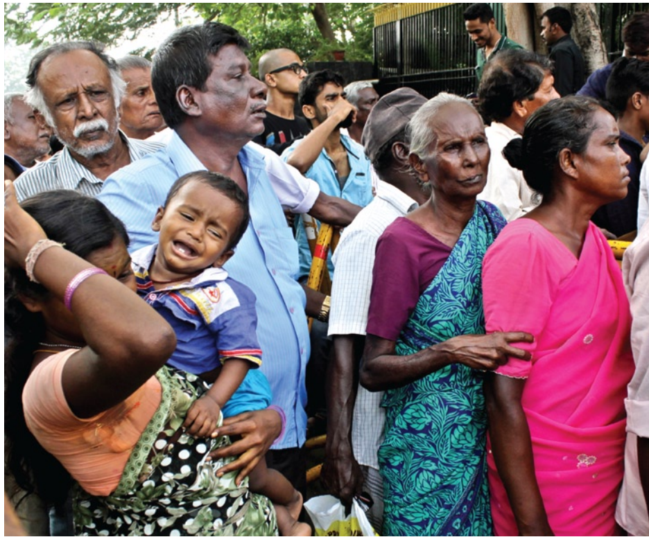
☑ നോട്ടിനായി ക്യൂ നിൽക്കുന്നവർ/ ഫോട്ടോ: അശ്വിൻ പ്രശാന്ത്/ എക്സ്പ്രസ്

ലക്ഷ്യത്തോടെയായിരുന്നു. ഉത്തർപ്രദേശ് തെരഞ്ഞെടുപ്പിനു മുൻപു സാമ്പത്തിക നയങ്ങൾ പുന:പരിശോധിക്കുക എന്നതായിരുന്നു നേതാക്കൾ തന്നെ വിശദീകരിച്ചിരുന്നത്. 41 പ്രാന്തപ്രചാരകരാണ് പങ്കെടുത്തത്. ആദ്യത്തെ മൂന്നുദിവസം ഉത്തർപ്രദേശ് തെരഞ്ഞെടുപ്പു കേന്ദ്രീകരിച്ചുള്ള നടപടികളും പിന്നീടുള്ള രണ്ടുദിവസം ദേശീയ നടപടികളും ചർച്ച ചെയ്തു. പക്ഷേ, എന്തായിരുന്നു ചർച്ചയെന്നു വെളിപ്പെടുത്താതെ പതിവ് ആർ.എസ്.എസ് യോഗത്തിൽ എന്നതുപോലെ നേതാക്കൾ മടങ്ങി. കേന്ദ്രസർക്കാരിനോടു രണ്ടു കാര്യത്തിൽ ആർ.എസ്.എസ് ശക്തമായി വിധേയമായിരുന്നില്ല. ഒന്നാമത്തേതു സാമ്പത്തിക രംഗത്തു വളർച്ച ഉണ്ടാകാത്തതിൽ ഉള്ള കുറുപ്പെടുത്തൽ. രണ്ടാമത്തേതു മാൻഡികൾ എന്നറിയപ്പെടുന്ന വലിയ മാർക്കറ്റുകളിലും ധനവിപണിയിലും നിയന്ത്രണം ഏറ്റെടുക്കാൻ സർക്കാരിനോ പിന്തുണയ്ക്കുന്നവർക്കോ കഴിയാത്ത